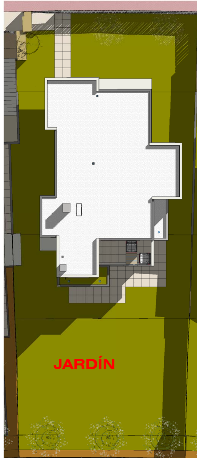
FICHA_V4_CUBIERTA 1 : 150