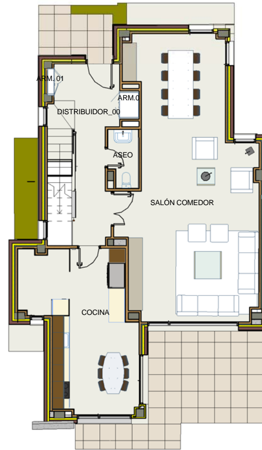
V4-PLANTA BAJA 1 : 125